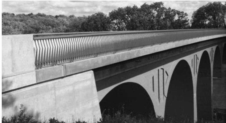
Ausgezeichnet mit dem Brandenburgischen Baukulturpreis 2009: die Brücke in Rosengarten, Frankfurt (Oder) (Ripke Architekten Berlin und VIC Brücken und Ingenieurbau GmbH Potsdam)

Die Ausschreibung mit den dazugehörigen Teilnahmebedingun-