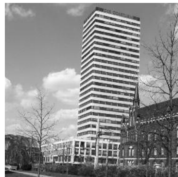
Oderturm und Hauptpost in Frankfurt (Oder)

Magistralen verhindern den Verkehrskollaps der Innenstädte. Man kann sie nicht einfach zurückbauen. Aus Sicht der Anwohner sind sie aber oft eine Katastrophe. Wenn man sich also nicht ohne weiteres von ihnen trennen kann, müssen sie eben durch Fußgängerbrücken, Mittelstreifennutzung, Kunstobjekte u.a.m. für den Fuß- und Radverkehr erlebbar gemacht werden. Trotz der notwendigen Fahrbahn-