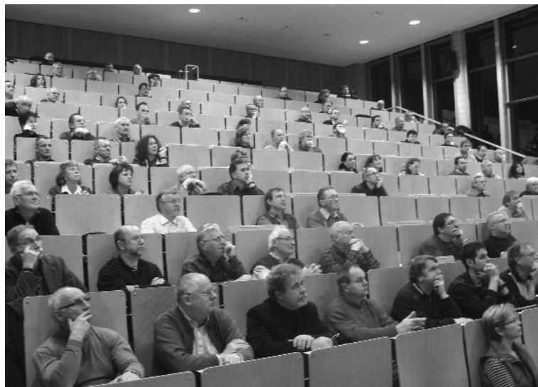
Mitgliederversammlung in Cottbus 2010

Am Beispiel des Dacheinsturzes in einem Einkaufszentrum wurde dargestellt, welche Mängel zu diesem Bauschaden führten.