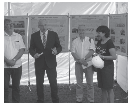
Pressekonferenz, Foto: Daniel Petersen