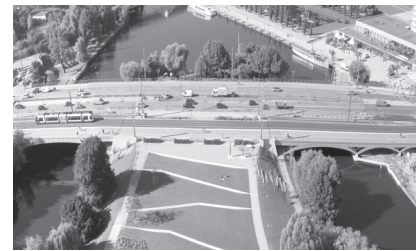
Lange Brücke Potsdam

Wieland Sommer Vors. Ausschuss für Öffentlichkeitsarbeit