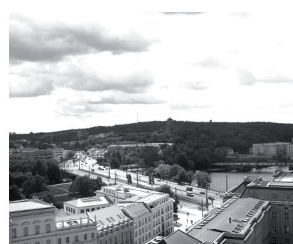
Lange Brücke Potsdam