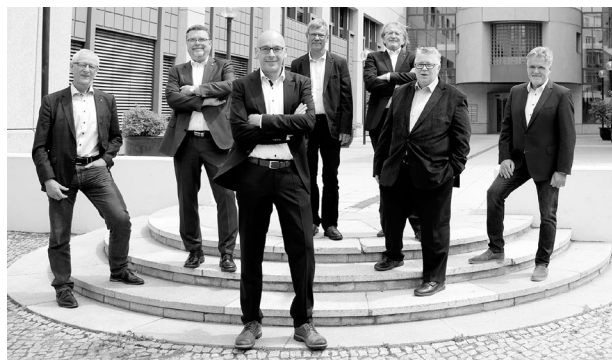
Vorstand der BBIK

Das Thema Baukultur wurde bereits 2021 stärker von uns in den Fokus gerückt und so wird es auch 2022 sein. Besonders im Hinblick darauf, dass das Themenjahr von Kulturland Brandenburg 2023 unter diesem