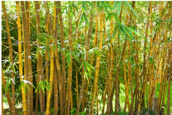
Abb. 1 Ideal für den Einsatz im Gebäudebau: Bambus ist ein hochwertiger Ersatzstoff für Holz und lässt sich auch ganz ähnlich verarbeiten.