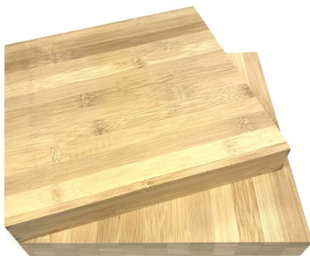
Abb. 3 Bambus lässt sich ähnlich wie Holz zu stabilen Platten verarbeiten.